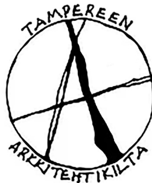
Kuva killan logosta.

Killan tunnusta voidaan käyttää killan hallituksen luvalla ja killan varsinaisessa toiminnassa.